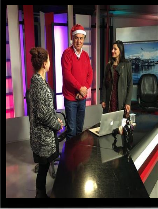
Sürpriz! SOS ekibi Yılbaşı Kampanyasını tanıtmak için canlı yayını bastı!