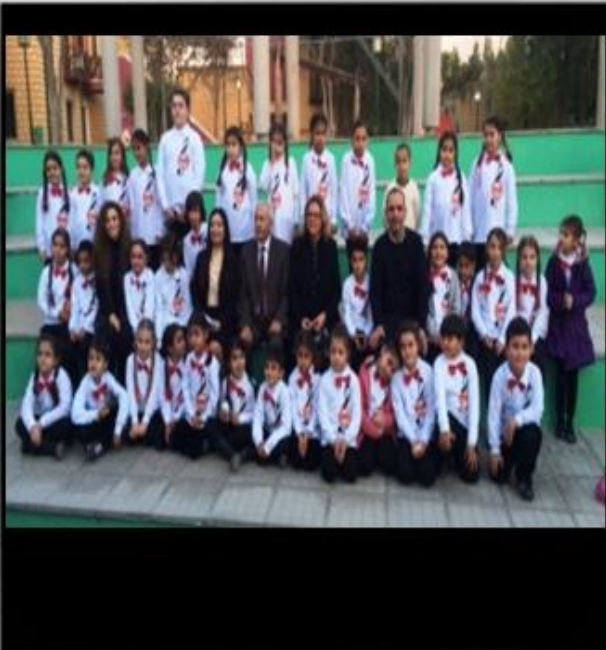
AB tarafından finanse edilen Aile Güçlendirme Projesi açılış etkinliği! Çocuklar başarılı bir koro gösterisinden sonra gururlandılar!